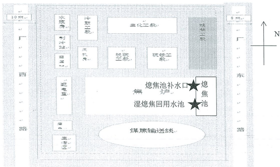
图 1 废水监测点位示意图